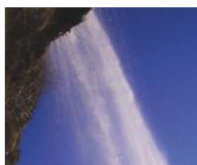
LA CASCATA "PISA VACA"

Nella seconda metà di marzo è possibile osservare la fioritura di questa liliacea. Si rinviene soprattutto in vecchi vigneti a gestione non eccessivamente intensiva, oppure al margine degli orti o su muretti a secco.