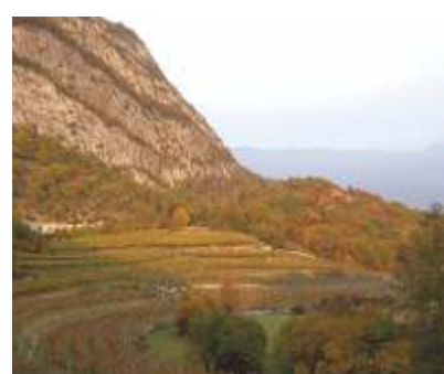
LE ROCCE CALCAREE GIURASSICHE

La "Pisa vaca", presso Patone, nel comune di Isera, è alimentata dalle acque provenienti dalla Costa dei Corni, in Loc. Bordala, ai piedi della dorsale del Monte Stivo. Insieme ai rii, alle forre, alle numerose altre cascate e le risorgenze che marciano diffusamente il territorio, testimonia la ricchezza idrologica della zona.