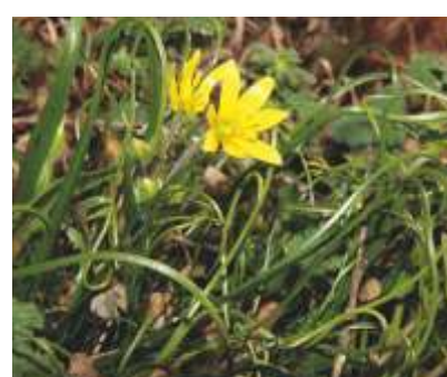
IL CIPOLLACCIO DEI CAMPI ( Gagea villosa )

Specie tipica delle valli aride più interne delle Alpi (ad esempio la Val Venosta), si rinviene in Trentino sul Doss Trento, e - estrema presenza verso sud - sulle rupi aride sopra Nomi.