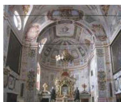
LA CHIESA DELLA NATIVITÀ DELLA VERGINE

Le prime notizie sulla chiesa, che si trova a Pomarolo, risalgono al 1232. Nel 1330 vi era unito un ospizio per pellegrini. Il campanile fu eretto prima del 1489. Dal XVII secolo fu trasformata in romitorio e l'ultimo eremita scomparve nel 1820. Si conservano tracce di importanti affreschi, databili alla prima metà del XIII secolo.