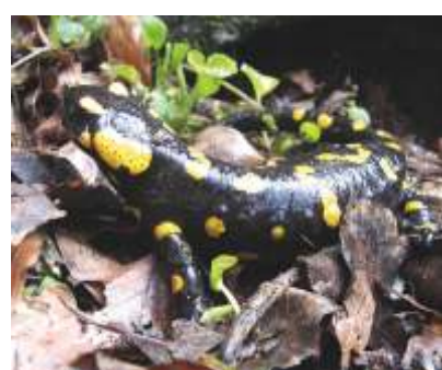
LA SALAMANDRA PEZZATA ( Salamandra salamandra )

È un raro anfibio dalle abitudini arboricole. La sua presenza è limitata alle zone umide del medio versante, in particolare della Val di Cei e delle località Palui e Zalere, dove vive nella vegetazione arborea e arbustiva nei pressi degli specchi d'acqua in cui si riproduce.