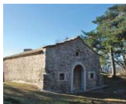
LA CHIESA DI SAN MARTINO

È uno dei roditori più comuni nel territorio della Destra Adige Lagarina. Occupa i boschi di latifoglie e misti, insediandosi anche negli edifici, fino a raggiungere le quote più elevate.