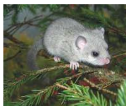
IL GHIRO ( Myoxus glis )

È un anfibio piuttosto comune nel territorio della Destra Adige Lagarina. Il suo habitat riproduttivo è rappresentato da ruscelli e piccole raccolte d'acqua negli ambienti boschivi di media-bassa quota.