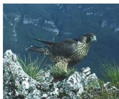
IL FALCO PELLEGRINO ( Falco peregrinus )

Una strada che unisce e collega paesaggi e tradizioni: castelli e altri siti archeologici; habitat rari e interessanti: praterie aride, rupi, zone umide; biodiversità floristica spontanea da scoprire; punti 'caldi' per l'evoluzione geologica del territorio; colture e attività tradizionali.