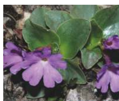
LA PRIMULA MERAVIGLIOSA ( Primula spectabilis )

Diffusa in zone montane dell'Appennino, sulle Alpi è in generale una specie rara. In Trentino è presente soprattutto sul versante orientale della catena Stivo-Bondone, dove è diffusa in punti rocciosi e aridi al di sopra degli 800 m.