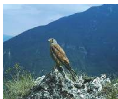
IL GHEPPIO ( Falco tinnunculus )

Fu probabilmente Nicolò Lodron a conferire nel 1593 al palazzo le sue eleganti forme tardorinascimentali. Si segnalano la torre portaia settentrionale e la cosiddetta Torre di Guardia all'estremità nordorientale del muro di cinta dei giardini ad est. All'interno, l'elegante cappella dedicata a San Carlo Borromeo.