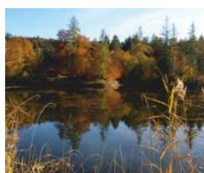
IL LAGO DI CEI

Incassato in rocce calcarenitiche eoceniche, si trova lungo la salita a Castellano, poche centinaia di metri a valle del bel terrazzo coltivato che si affaccia sulla Vallagarina.