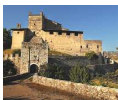
CASTELNUOVO ( Castel Noarna )

Nel XII secolo a Noarna sorse il castello, noto anche come Castelnuovo. L'edificio dei Castelbarco, dal 1456 possesso dei Lodron, conserva memoria della vocazione difensiva ma mostra anche la conversione in residenza signorile. All'interno, la più antica copia degli affreschi della Cappella Sistina.