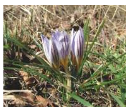
LO ZAFFERANO SELVATICO ( Crocus biflorus )

Nel XII secolo a Noarna sorse il castello, noto anche come Castelnuovo. L'edificio dei Castelbarco, dal 1456 possesso dei Lodron, conserva memoria della vocazione difensiva ma mostra anche la conversione in residenza signorile. All'interno, la più antica copia degli affreschi della Cappella Sistina.