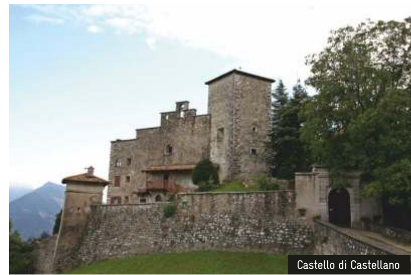
Castello di Castellano