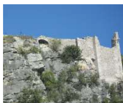
CASTELLO DI NOMI

Castel Corno, sviluppatosi su di un ripido sperone roccioso, è uno dei manieri medievali più suggestivi della Destra Adige Lagarina. Documentato sin dal 1178, visse alterne vicende e passò di mano in mano fino al XVIII secolo. Le grotticelle ai piedi del castello furono occupate nell'antica età del Bronzo.