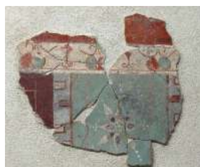
LA VILLA ROMANA

Situata su un'altura nei pressi del Lago di Cei, si ipotizza che sia stata costruita anteriormente al X secolo. Dalla prima metà del Seicento il luogo fu trasformato in eremitaggio. Di recente è stato riacquisito dal Comune di Villa Lagarina che ne ha promosso il recupero.