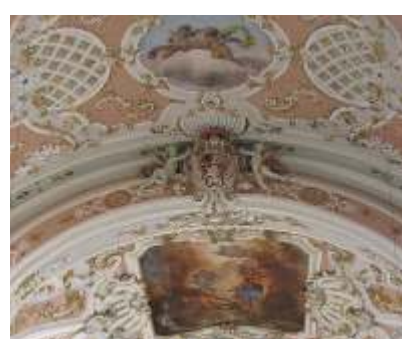
LA CHIESA ARCIPRETALE DELL'ASSUNTA

Da Noarna verso Castellano, il sentiero collinare si presenta in alcuni punti allo stato originario. Si riconoscono i profondi solchi incisi nella roccia dal passaggio delle ruote dei carri, segno tangibile della presenza dell'uomo e della sua continuità nel tempo.