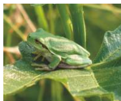
LA RAGANELLA ITALIANA ( Hyla intermedia )

È presente stabilmente lungo i versanti rocciosi della Destra Adige Lagarina. Questo rapace caccia spesso sorvolando aree urbane e agricole dove cattura uccelli di piccola e media taglia al termine di spettacolari picchiate.