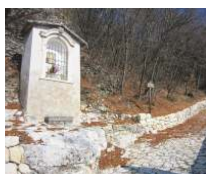
IL "CAPITEL DE LE COSTE"

Preziosa specie endemica di un limitato settore delle Prealpi, è presente anche nel territorio della Destra Adige Lagarina, comparando con sporadici esemplari sui dirupi sottostanti Cima Bassa.