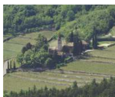
LA CHIESA DI S. ANTONIO

Il lago di Cei è il più grande dei tanti specchi lacustri a scarso ricambio d'acqua di cui è ricca la zona. La conca di Cei è una tipica valle dai tratti glaciali, rimodellata in epoca più recente da fenomeni gravitativi, come frane e caduta di detriti.