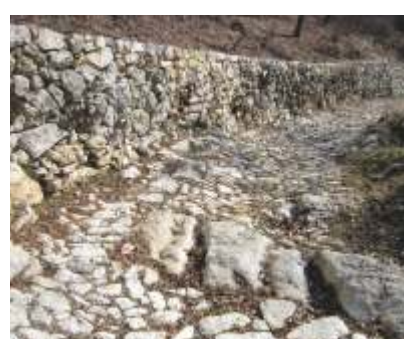
IL SENTIERO COLLINARE

Vista autunnale della porzione più orientale della conca di Servis (Pomarolo), ai piedi della dorsale della Corona, qui marcata da una maestosa parete in rocce calcaree giurassiche.