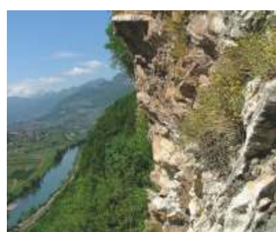
L'EFEDRA ELVETICA ( Ephedra helvetica )

La chiesa, situata a Brancolino, è documentata dal 1240. Venne affidata dal XVI secolo ai Frati Minori Antoniani, ospitati nell'adiacente convento fondato per volontà di Veronica Lodron. L'interno racchiude un'eccezionale testimonianza artistica, a partire dalla decorazione pittorica di stile barocco.