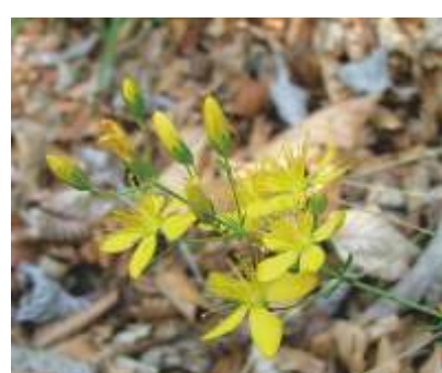
L'IPERICO AGHIFOLGIO ( Hypericum ochrosus )

Solo a inizio marzo è possibile osservare questa splendida Iridacea. Comune nel Mediterraneo, penetra lungo la Valle dell'Adige da sud verso nord fino alle pendici aride che sovrastano Nomi.