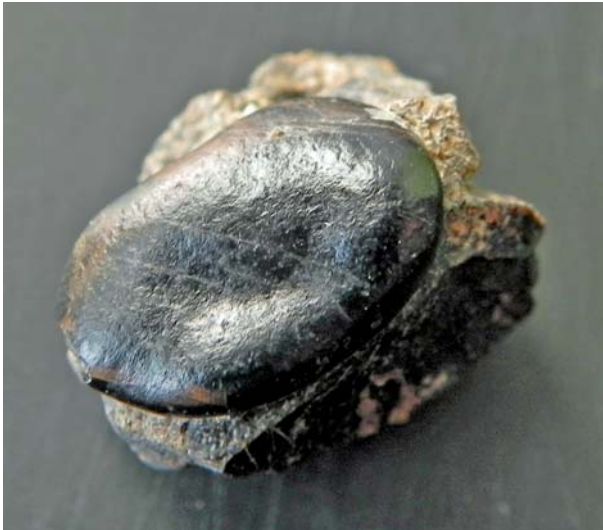
Fig. 2 - Dente palatino di Cyamodontidae rinvenuto a Rumerlo, Dolomiti orientali.

L'esemplare, depositato presso il Museo Civico di Rovereto n. cat. FOS03838, è composto di un dente completo posto su un frammento osseo probabilmente del mascellare sinistro di un Cyamodontoidea. Il dente presenta forma subovale, allungata, con asse maggiore di mm 11.9 ed asse minore, ortogonale al primo, di mm 7.5. La superficie di masticazione è integra e poco usurata, ma presenta delle lievi strisciature subparallele, che la attraversano obliquamente, dovute probabilmente ad abrasioni recenti. La superficie di masticazione si caratterizza per un rigonfiamento marginale ad anello, che presenta due rigonfiamenti apicali delimitati da lievi depressioni lineari e un ampio cuscinetto centrale. Quest'ultimo si sviluppa, senza soluzione di continuità, dal bordo esterno del rigonfiamento marginale verso il centro della superficie di masticazione; si delimita così una stretta depressione centrale disposta obliquamente fra il cuscinetto e l'ampio rigonfiamento marginale del lato opposto (Fig. 2).