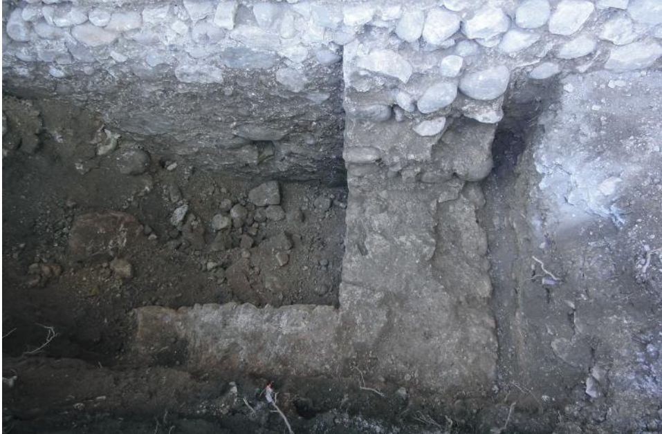
Fig. 9 - Strutture murarie messe in luce in corrispondenza del tratto nord del muro perimetrale.