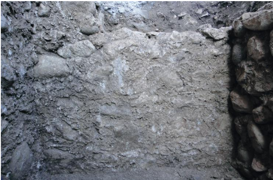
Fig. 10 - Prospetto sud del muro orientato est-ovest, legato al perimetrale orientale della villa romana (foto B. Maurina).