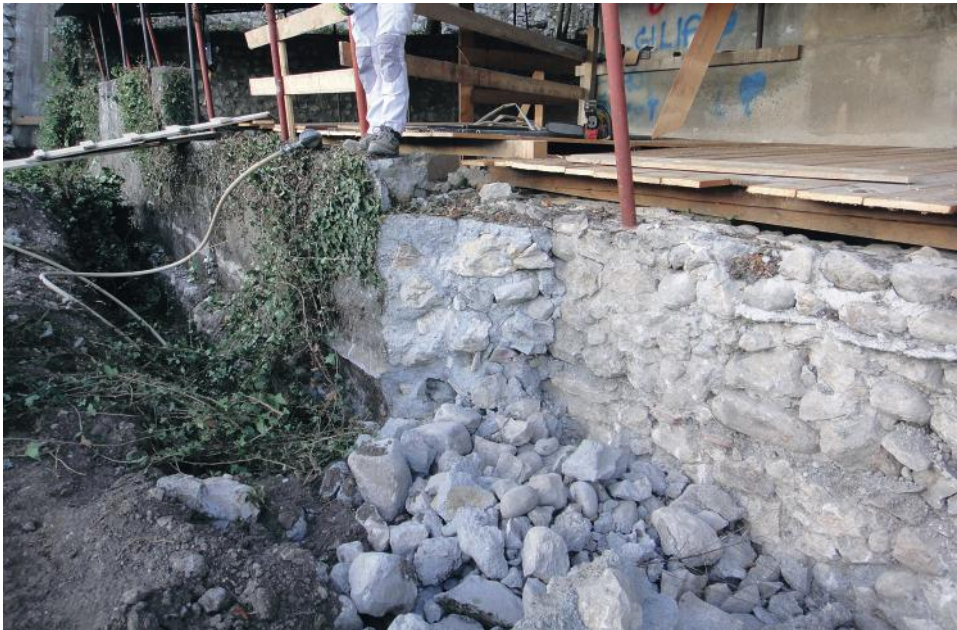
Fig. 4 - Una fase della demolizione del muro di cemento appoggiato al perimetrale est della villa romana.