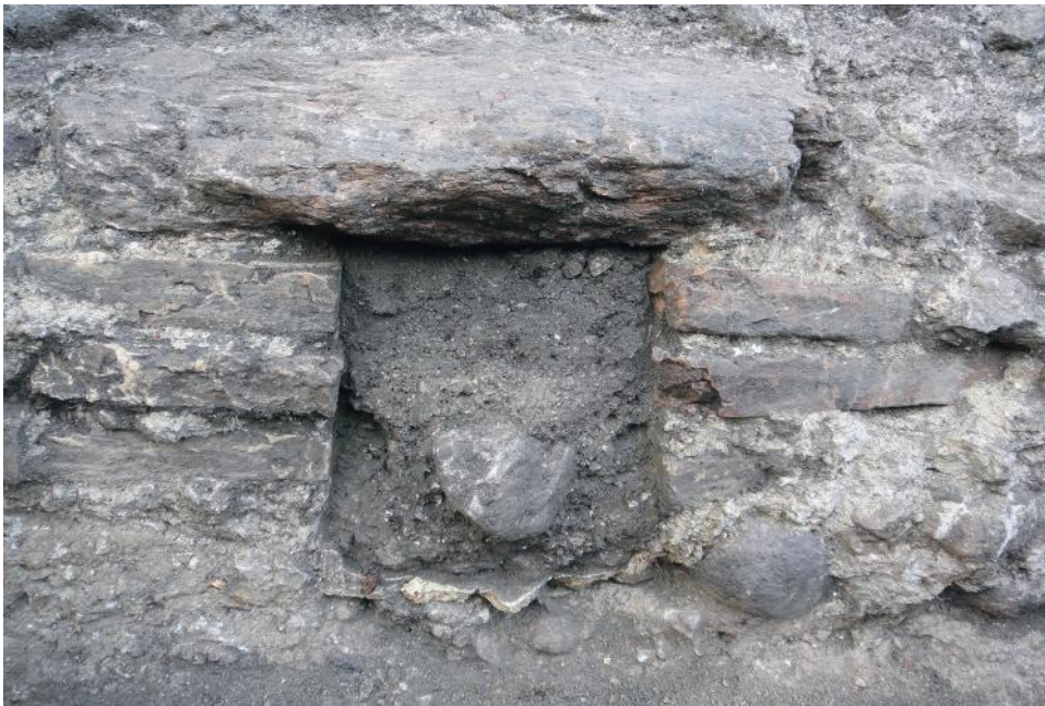
Fig. 8 - Lo sbocco del condotto fognario nel tratto meridionale del muro perimetrale est.