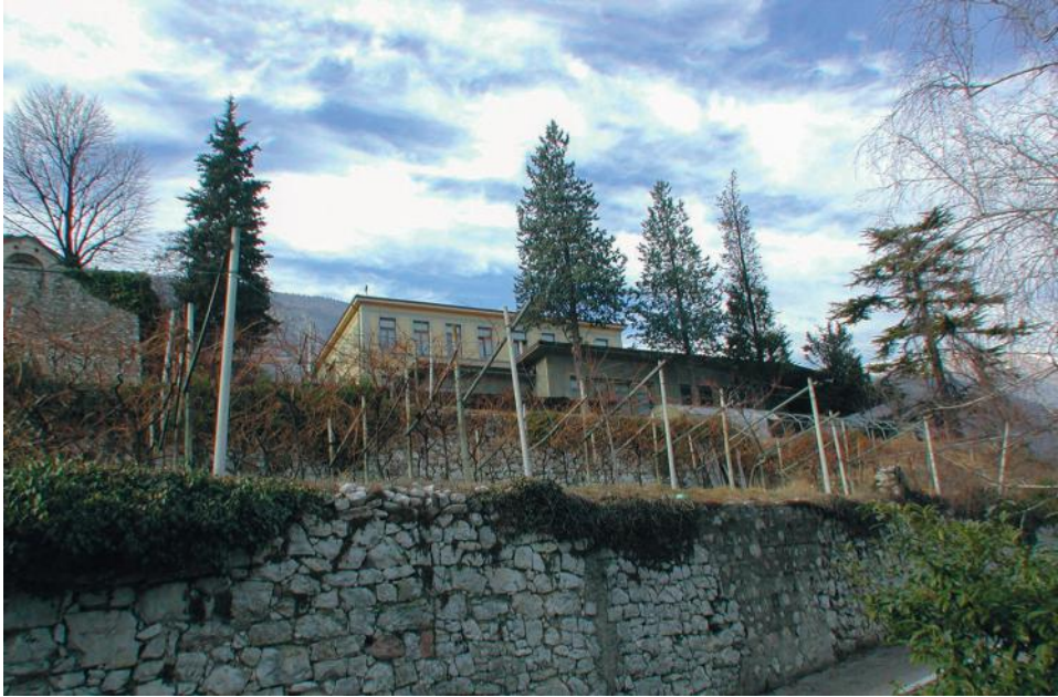
Fig. 3 - Il vecchio asilo di Isera e, in secondo piano, la scuola elementare; ripresa da est.