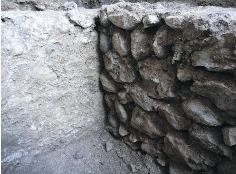
Fig. 11 - Muro orientato nord-sud, in relazione di appoggio rispetto al setto murario est-ovest.

fabbricato antico (A 13), presenta spallette in laterizi, alla base reca una tegola ed è coperta da una lastra di calcare rosso ammonitico.