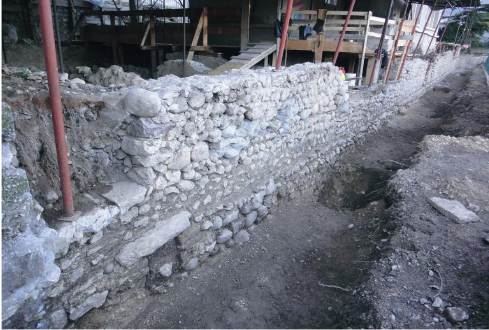
Fig. 5 - Prospetto del muro perimetrale est della villa romana; ripresa da sud.