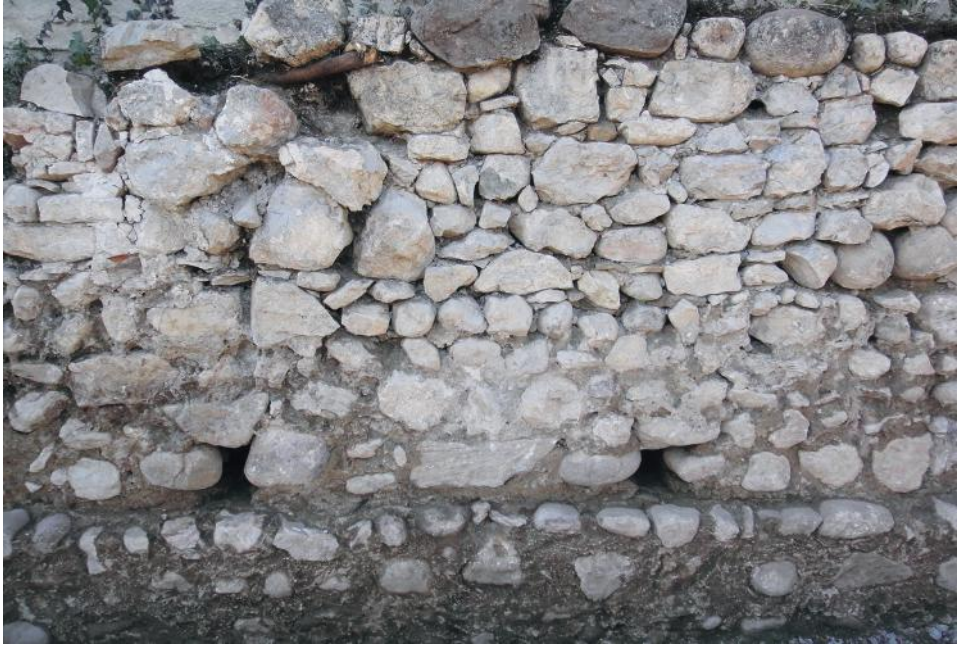
Fig. 7 - Particolare del prospetto del muro perimetrale est della villa romana.