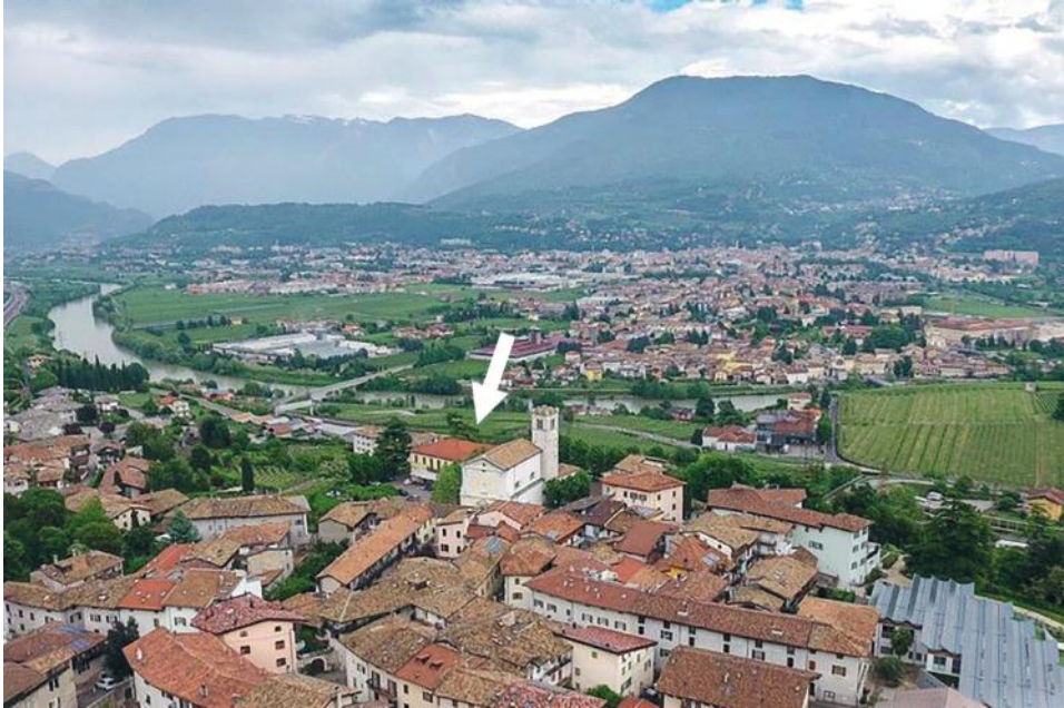
Fig. 1 - Panoramica della valle dell'Adige e dell'abitato di Isera, ripresa da ovest; la freccia indica la posizione dei resti della villa romana.

Com'è noto, dopo una lunga stagione di scavi e ricerche condotte dal Museo Civico di Rovereto in collaborazione con l'Associazione Lagarina di Storia Antica, il Comune di Isera e la Soprintendenza per i Beni Culturali della Provincia Autonoma di Trento (1) , da molti anni i resti della Villa romana di Isera (Fig. 1-2) erano in attesa di un sostanziale intervento che permettesse, in primis attraverso una nuova struttura di copertura, di tutelare il sito e al contempo garantirne un'adeguata fruizione da parte del pubblico (2) . Dopo lunghi anni di analisi, riflessioni e verifiche progettuali, grazie allo sforzo congiunto della Soprintendenza per i Beni Culturali della Provincia Autonoma di Trento e del Comune di Isera, nell'autunno-inverno del 2019 si è dato avvio al cantiere edile finalizzato a un articolato intervento di conservazione e valorizzazione dei resti archeologici (3) .