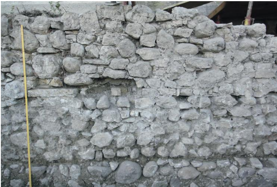
Fig. 6 - Particolare del prospetto del muro perimetrale est della villa romana (foto B. Maurina).